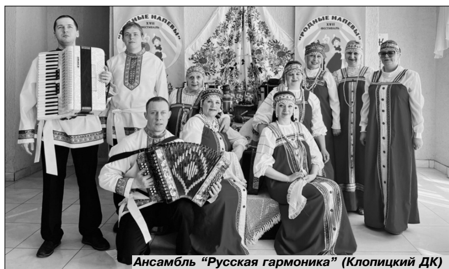
Ансамбль "Русская гармоника" (Клопицкий ДК)

Впервые на сцену вышли в качестве исполнителей руководители хоров, ансамблей и дуэтов. Жюри оценило их высокий уровень мастерства специальными дипломами и приняло решение о введении в конкурсную программу номинации "Профессионалы". А пока специальный