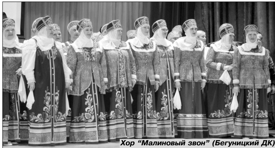
Хор "Малиновый звон" (Бегуницкий ДК)

классики, давно ушедшие в народ, так и любимые образцы народного песенного творчества.