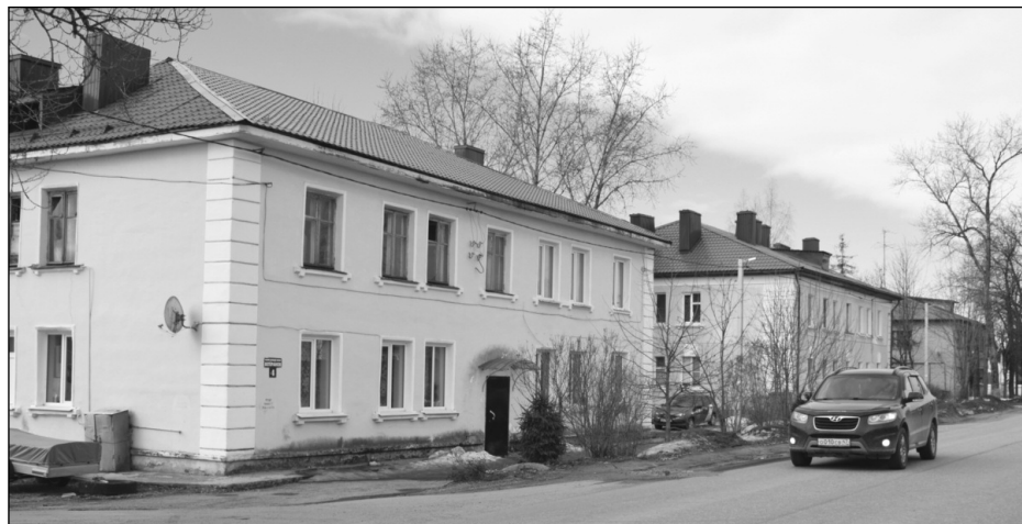
• ДАЛЕКОЕ - БЛИЗКОЕ