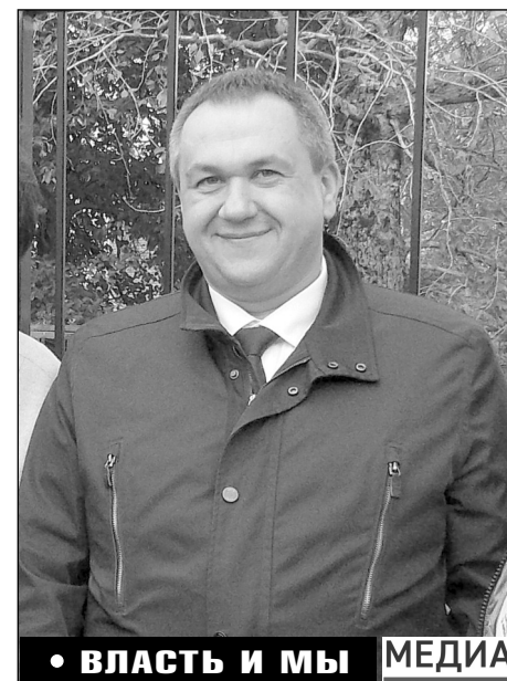
• ВЛАСТЬ И МЫ

При годовом плане 17 638 тыс. руб. на сферу культуры израсходовано 17 631 тыс. руб. или 99% от плана.