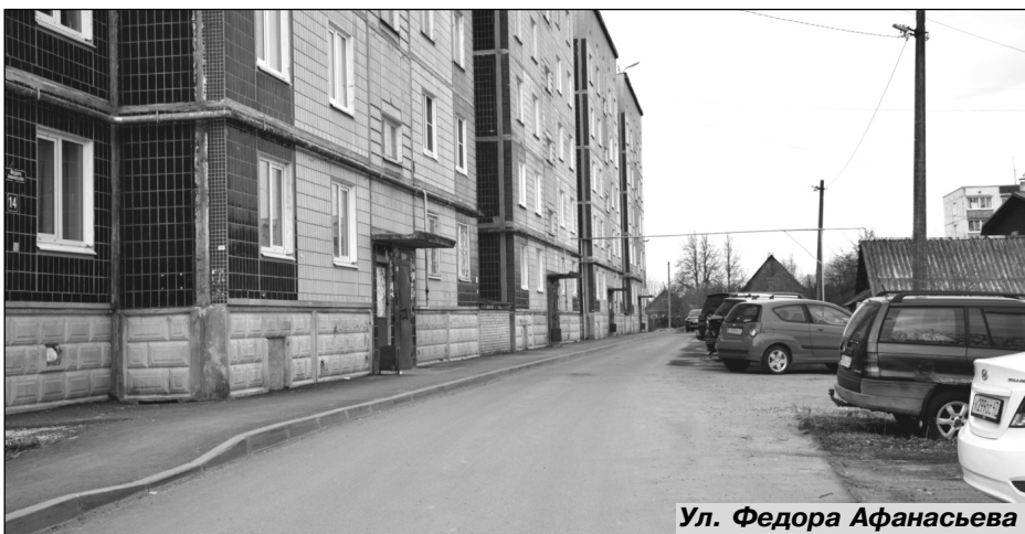
Ул. Федора Афанасьева

первый выпуск учеников из школы-семилетки. В 1939 году построили второе школьное здание. Оно находилось там, где сейчас стадион школы №2. Здания были однотипными. Школа стала десятилетней.